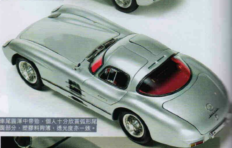
車尾圓渾中帶勁，個人十分欣賞弧形尾窗部分，塑膠料夠薄，透光度亦一致。