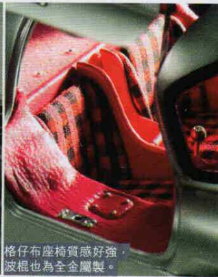
格仔布座椅質感好強， 波棍也為全金屬製。