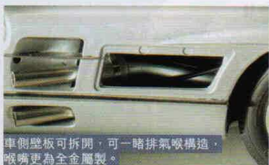
車側壁板可拆開，可一睹排氣喉構造，喉嘴更為全金屬製。