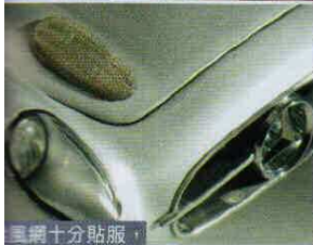
三網十分貼服， 亦不存嚴重膠感。