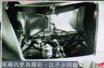
尾箱內更為精彩，比不少同級 模型的引擎部分還要精密。