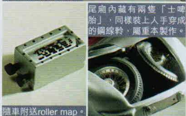
尾廂內藏有兩隻「士啤胎」，同樣裝上人手穿成的鋼線鞍，屬重本製作。