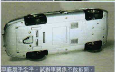
車底幾乎全平，試辦車關係不敢拆開，不知內裡包含車架結構與否。