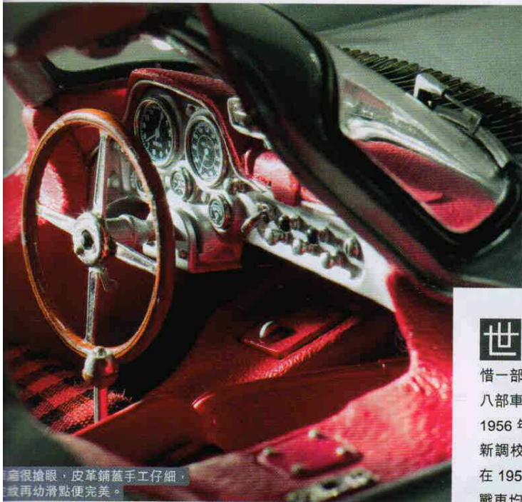
這套很搶眼，皮革鋪蓋手工仔細， 皮紋再幼滑點便完美。