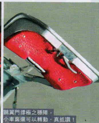
鷗翼門撐極之穩陣， 小車窗還可以轉動，真抵讚！