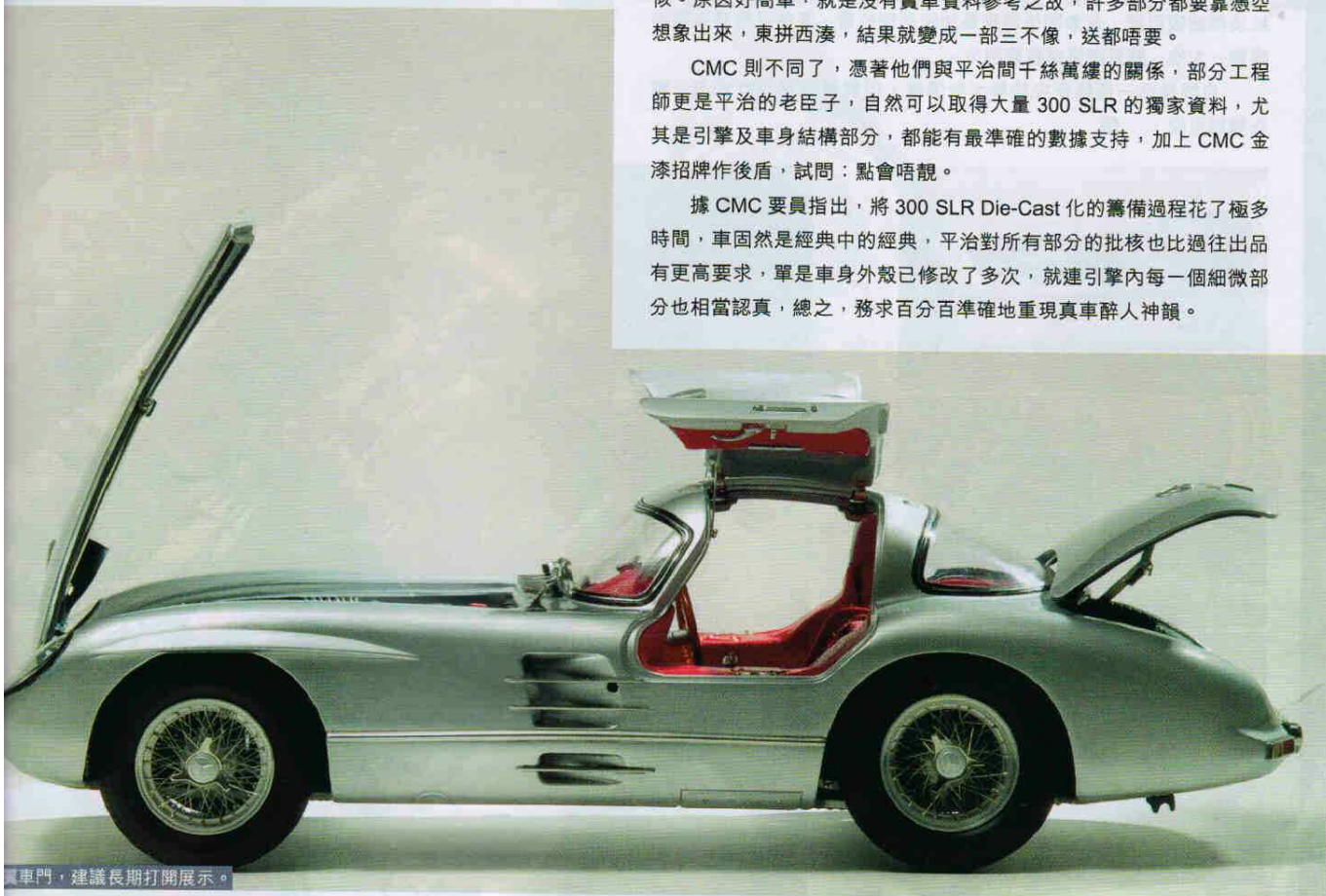
鷗翼車門，建議長期打開展示。

據 CMC 要員指出，將 300 SLR Die-Cast 化的籌備過程花了極多時間，車固然是經典中的經典，平治對所有部分的批核也比過往出品有更高要求，單是車身外殼已修改了多次，就連引擎內每一個細微部分也相當認真，總之，務求百分百準確地重現真車醉人神韻。