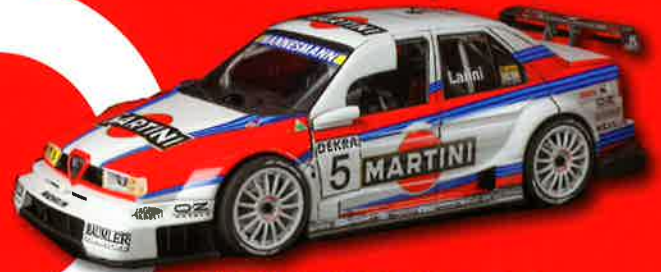
ALFA ROMEO 155 V6 TI DTM 1993